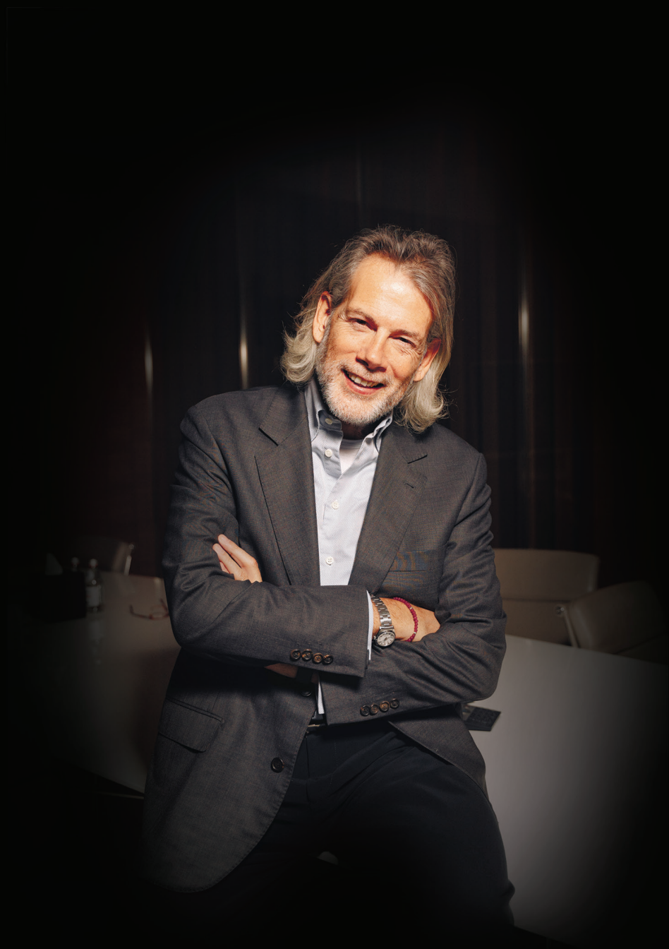
Рикардо Марини, Итальянский архитектор